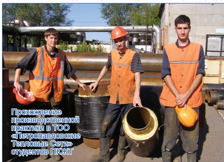
Прохождение производственной практики в ТОО «Петропавловские Тепловые Сети» студентов ПКТ

- Программа для молодых специалистов готовилась в течение года. В процессе ее формирования проводили опрос среди студентов. На самом деле, наши специалисты прекрасно знают настроение и мотивацию студентов, потому что работают с ними ежедневно не первый год. К примеру, опытные сотрудники «СЕВКАЗЭНЕРГО» на протяжении нескольких лет входят в состав экзаменационных комиссий учебных заведений, принимают участие в