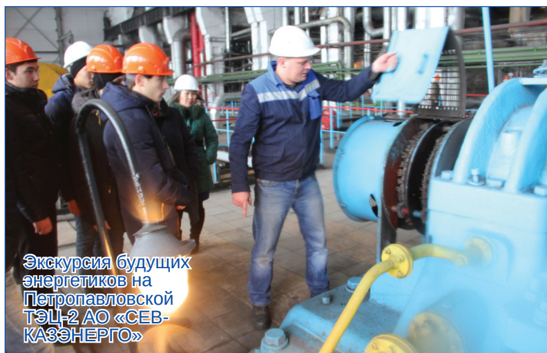
Экскурсия будущих энергетиков на Петропавловской ТЭЦ-2 АО «СЕВКАЗЭНЕРГО»